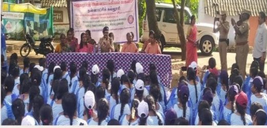
நாட்டு நலப்பணித்திட்டம் தூய்மை இந்தியா-24/11/23

ஜெயராஜ் அன்னபாக்சியம் மகளிர் தன்னாட்சி கல்லூரியின் நலப்பணித்திட்டம் சார்பாக பெரியகுளம், எண்டப்புளி ஊராட்சிக்குட்பட்ட, ஜே.கே. காலனியில் தூய்மை இந்தியா என்னும் நிகழ்வு நடைபெற்றது.