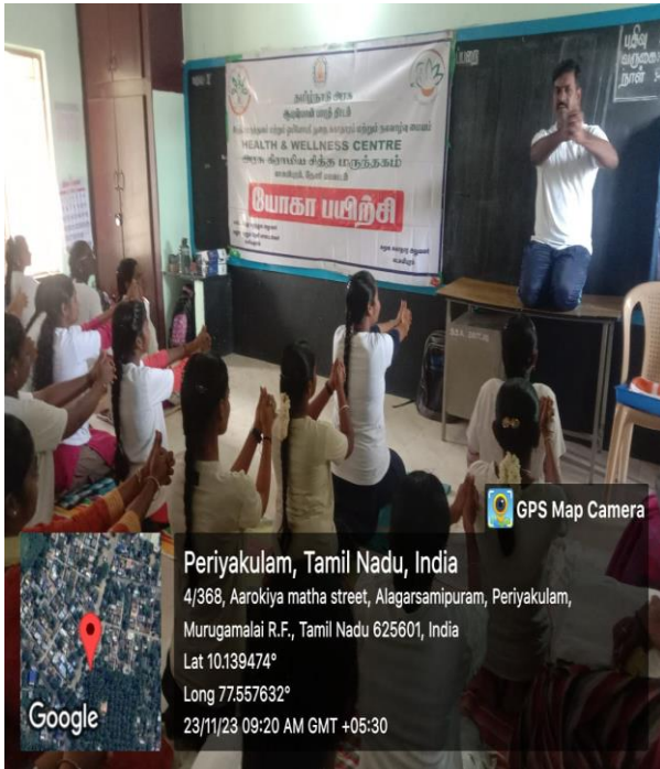
Periyakulam, Tamil Nadu, India 4/368, Aarokiya matha street, Alagarsamipuram, Periyakulam, Murugamalai R.F., Tamil Nadu 625601, India Lat 10.139474° Long 77.557632° 23/11/23 09:20 AM GMT +05:30