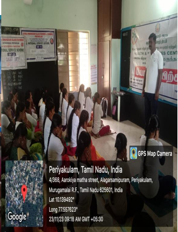
Periyakulam, Tamil Nadu, India 4/368, Aarokiya matha street, Alagarsamipuram, Periyakulam, Murugamalai R.F., Tamil Nadu 625601, India Lat 10.139492° Long 77.557623° 23/11/23 09:18 AM GMT +05:30